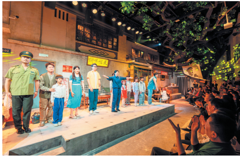
沉浸式街区戏剧《长沙》,以上世纪90年代长沙老街巷为底色。长沙晚报全媒体记者 郭雨滴摄

“听着长沙话感觉很亲切”,观众陈朝锦表示,“感觉自己也穿越到那个年代,成了他们的街坊邻居,沉浸感太强了。”