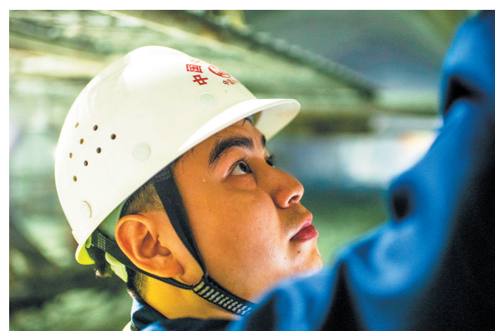
↑不一会儿,钟旭满头大汗。