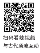
扫码看辣视频 与古代顶流互动

从晨光熹微到华灯满园,这个“五一”,橘子洲江天暮雪文化园以一场跨越千年的风雅之约,让市民游客在休闲度假中深度感受湖湘文化的独特魅力。