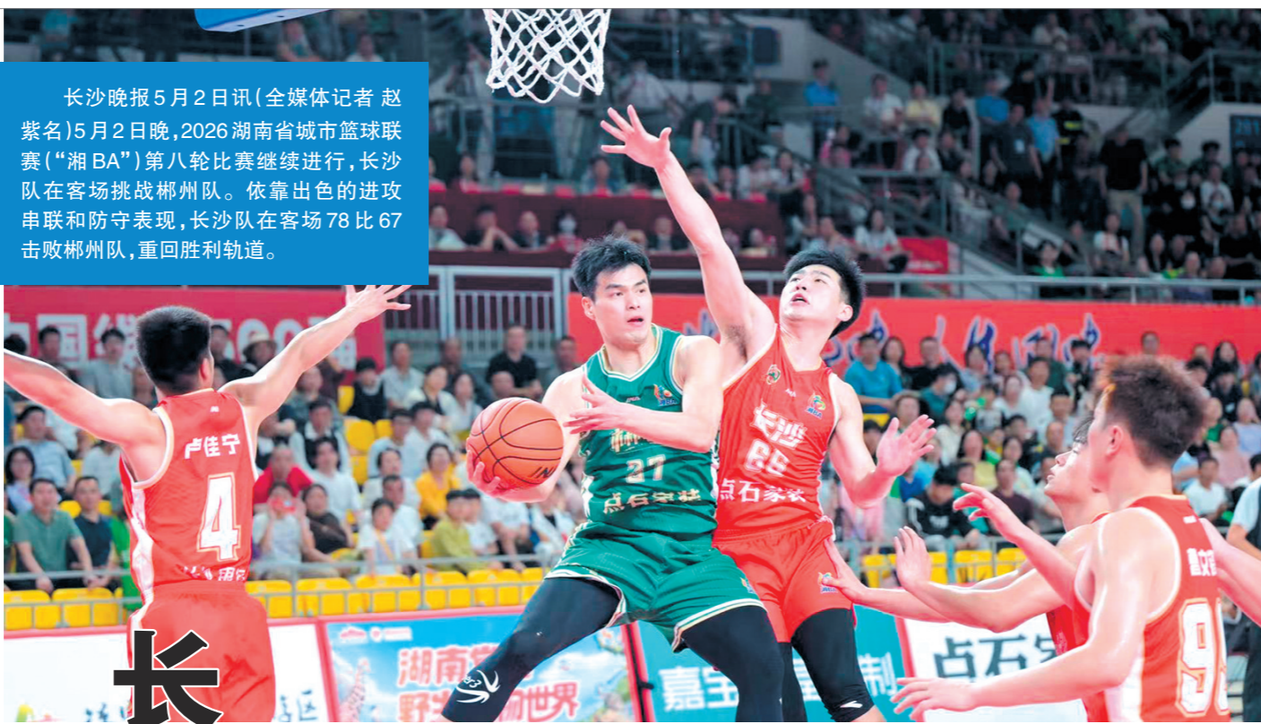
5月2日晚,2026“湘BA”第八轮焦点战在郴州市体育中心打响,长沙队78比67力克对手。