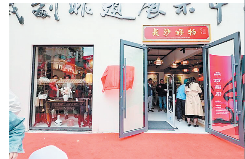
长沙戏剧非遗街凭借戏曲展演、非遗手作、潮流市集、沉浸式剧本探秘等多元业态,成为市中心新晋文旅地标。

为契合年轻群体游玩喜好,长沙戏剧非遗街创新文旅业态,引入沉浸式剧本杀、实景解谜等新潮玩法,把定王台历史典故与湖湘非遗巧妙融入剧情。游客变身剧情参与者,在街巷间游走探索、解谜闯关,于趣味互动中品读定王台千年历史、聆听湖湘非遗故事。街区一改传统非遗展演单调刻板的形式,让传统文化变得年轻化、潮流化,已然成为年轻游客打卡长沙非遗的首选去处。