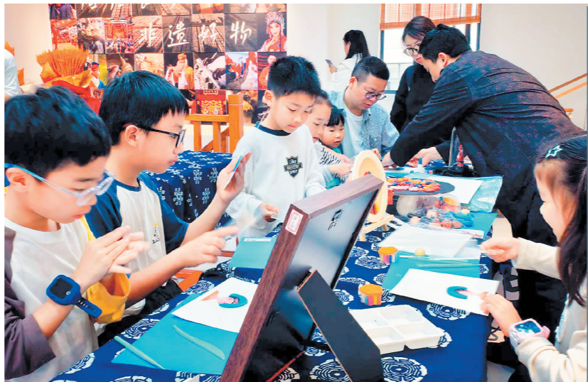
市民游客在长沙好物展厅里体验非遗手工。

长沙湘剧保护传承中心演员也在5月2日、3日登陆滨江文化园开展惠民展演,以专业唱腔演绎传承湘剧文脉,让湖湘传统戏曲多点布局、惠及全民。