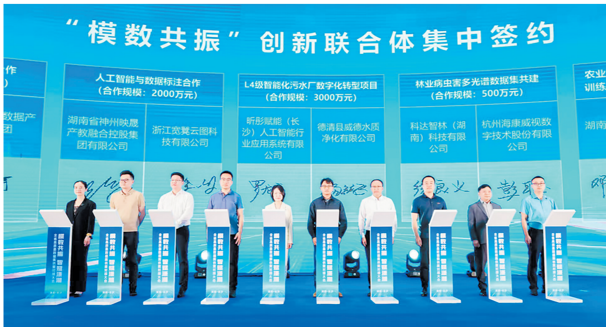
“模数共振”创新联合体集中签约。

工业和信息化部、国家数据局近日联合印发通知,正式启动2026年“模数共振”行动,明确提出要推动人工智能模型与数据资源协同互促、同频共振,