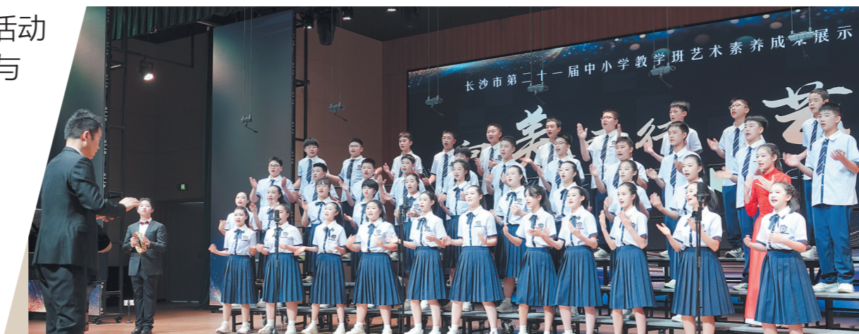
长沙市第二十一届中小学教学班艺术素养成果展示活动以“向美而行·艺术筑梦”为主题,覆盖约11100个建制班级、超50万名学生,规模创历史新高。

今年新学年初,新教材发下来后,雨花区砂子塘天华小学的学生们在湘艺版2024义务教育教科书《艺术·音乐》三年级下册的封面上,看到了自己的演出照。雨花区魅力小学“星辰合唱团”录制的19首童声范唱,也正式亮相湘艺版2024义务教育教科书《艺术·音乐》三年级下册。