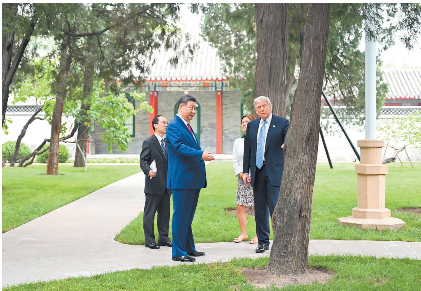
5月15日上午，国家主席习近平在中南海同美国总统特朗普举行小范围会晤。这是特朗普抵达时，习近平热情迎接。

特朗普表示，非常感谢习近平主席邀请我到中南海做客。此次访华是一次非常成功的访问，举世瞩目，令人难忘。双方形成一系列重要共识，达成多项协议，解决了不少问题，对两国和世界都十分有益。习近平主席是我的老朋友，我十分尊重习近平主席，我们建立了良好的关系。