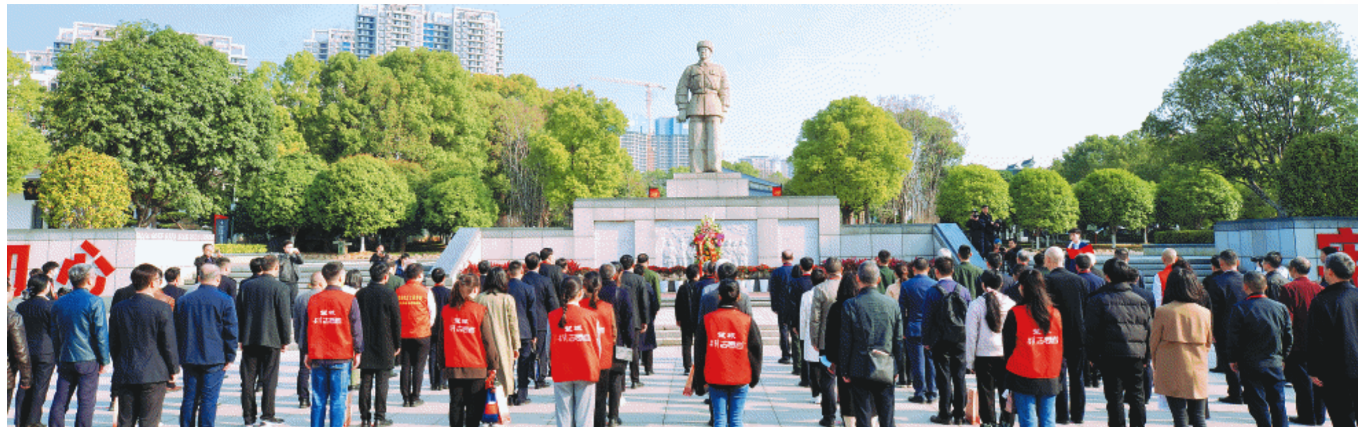
学雷锋先进英模志愿者们向雷锋雕像敬献花篮。