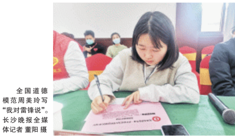
全国道德模范周美玲写“我对雷锋说”。

“雷锋家乡小雷锋”、全国道德模范周美玲认为,雷锋的伟大之处在于他做了什么惊天动地的大事,而在于他一点一滴的奉献,“勿以善小而不为”。“青春少年传承雷锋精神正当时。无论在哪个时代,我们都不能忽略新兴血液,每一个人都可以成为志愿者。”周美玲呼吁广大青少年,我们如一滴水、一缕光、一粒粟、一颗螺丝钉,纵然渺小,理应有朝气,在奉献中追寻人生意义与价值。